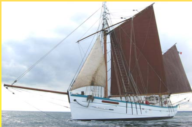
FLEUR DE LAMPAUL

- Les documentaires issus des reportages sont des supports pédagogiques mis à disposition tout au long de l'année pour les équipes éducatives.